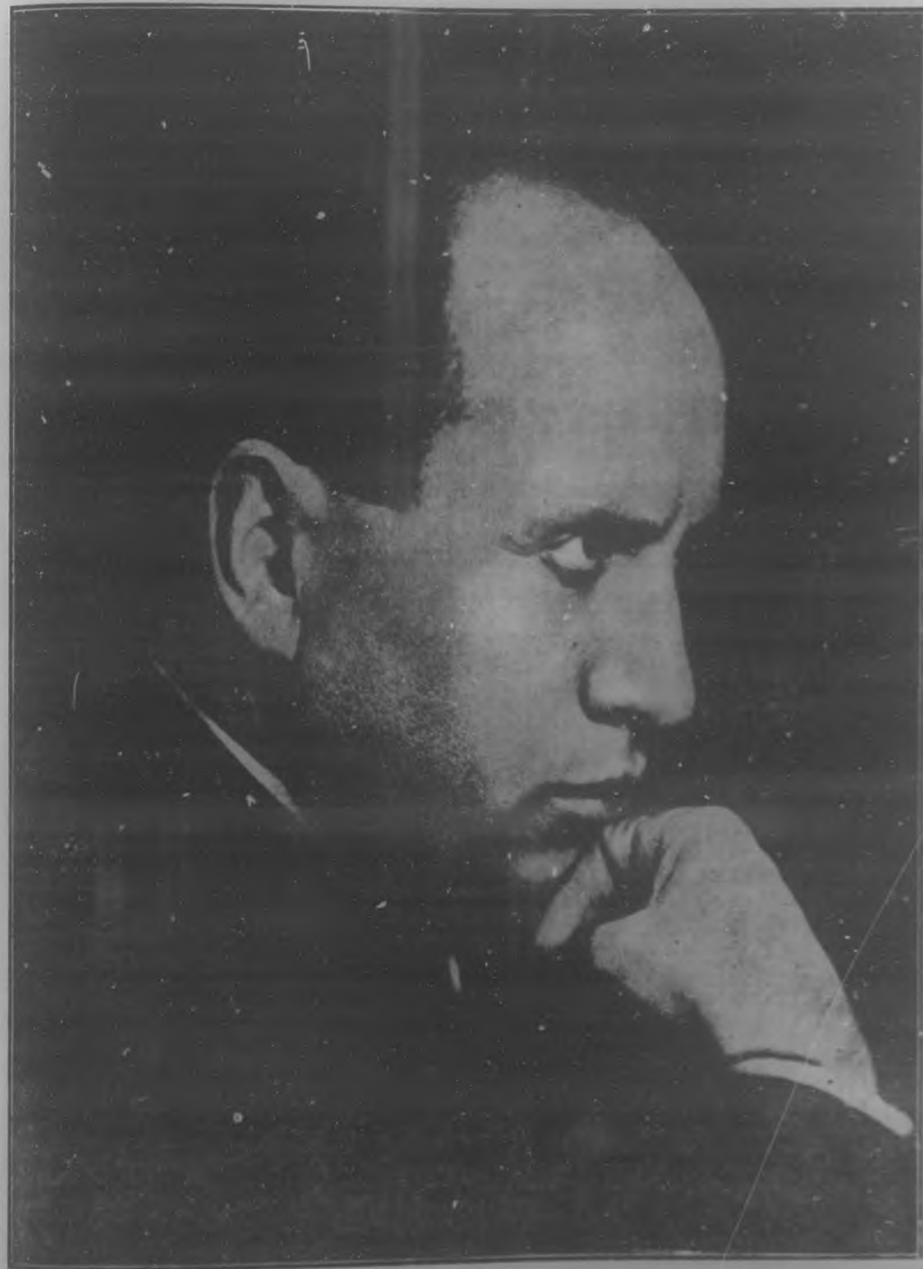
Sgr Benito Mussolini.—el ilustre jefe de los "fascisti" italianos, que al resultar victorioso éstos en su reciente movimiento revolucionario, ha sido nombrado Primer Ministro del Reino.

Redacción, Administración y Talleres: Edificio de BOHEMIA, Trancas número 20, 91 y 93— Teléfonos: Dirección M-1127; Administración, A-1818.