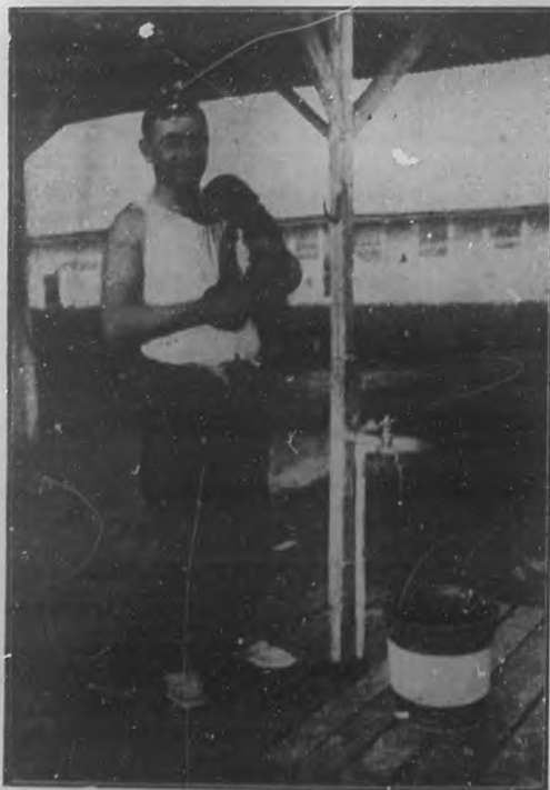
Un "mozo de establo" tipo de irlandés al cuidado de las caballerizas en el Hipódromo de Mariano.

En uno de nuestros números anteriores publicamos una serie de fotografías de artistas pertenecientes a la Compañía de Ópera Metropolitan que actuará en "Payret" a fines de este mes.