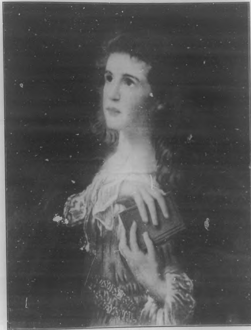
RETRATO Oleo de Souts Swakening.

Reloj, corazón metálico que late férrea e isócronamente; roedor crugiente e infatigable; corazón cronométrico, tu siniestro y áspero palpitar no puede por menos que sumir al hombre en un océano de tristeza si detenidamente considera que por cada uno de tus rechinantes latidos se le fuga una partecilla de su deleznable o frágil existencia, aproximándose más y más al enigmático término de su penoso viaje en marcha ininterrumpida hacia la incognoscible región de ultratumba.