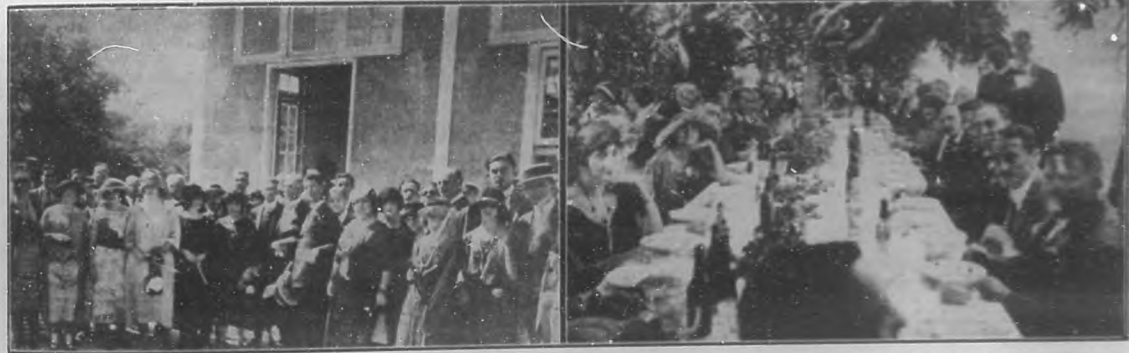
A la izquierda.—Algunos de los congresistas e invitados que asistieron al almuerzo ofrecido a los delegados al Congreso Médico en los manantiales de San Francisco de Paula.—A la derecha: Vista de la concurrencia que asistió al mencionado almuerzo.

Accediendo a los ruegos de un grupo de distinguidos y jóvenes doctores y estudiantes, el ilustre rector de la Universidad de Buenos Aires, Dr. José Arce, ofrecerá una conferencia en la Universidad Nacional, en la tarde de mañana lunes, a las cinco, teniendo por tema la evolución de las universidades argentinas.