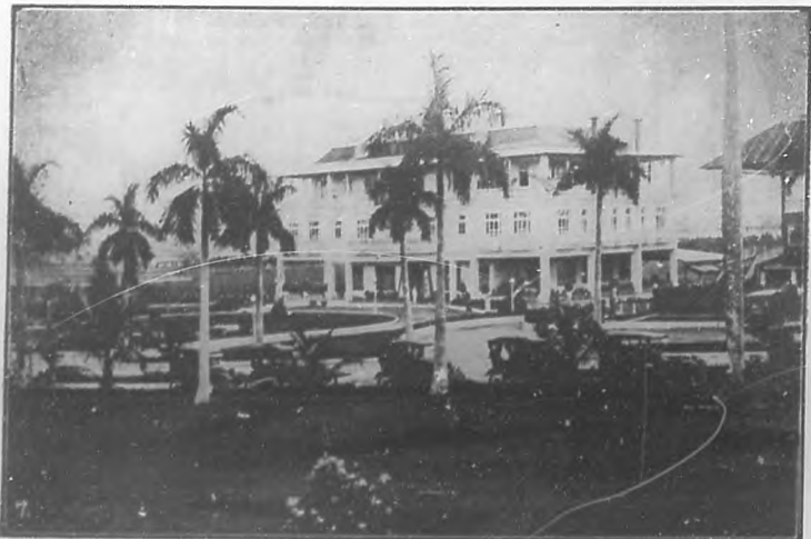
Club-house y jardines de la hermosa residencia social del "Cuba-American Jockey & Auto Club" en el hermoso "Oriental Park".

El jueves se inauguró la nueva temporada en Oriental Park . Cuando el primer grupo de caballos se dirigió al post, una ráfaga de satisfacción, un escalofrío de placer, recorrió los cuerpos