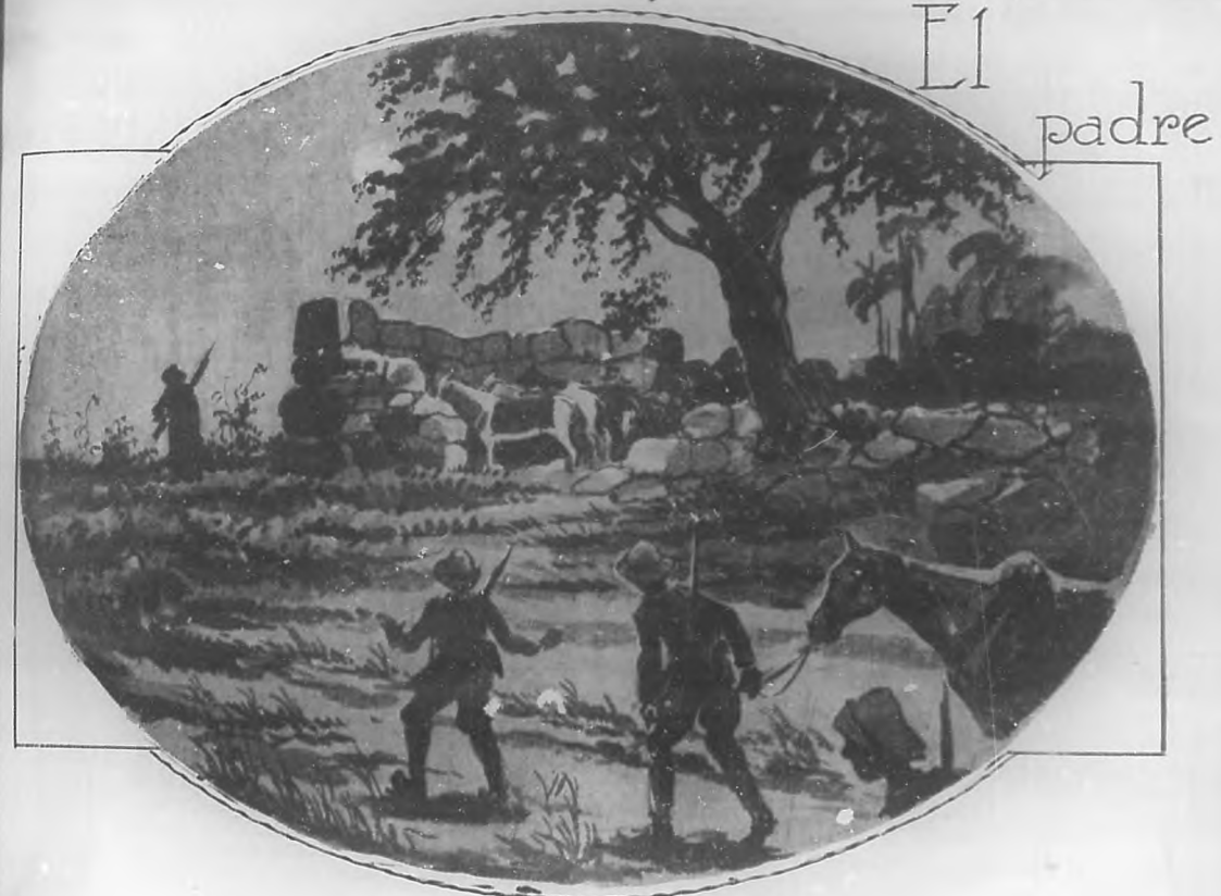
POR HELIODORO GARCIA ROJAS