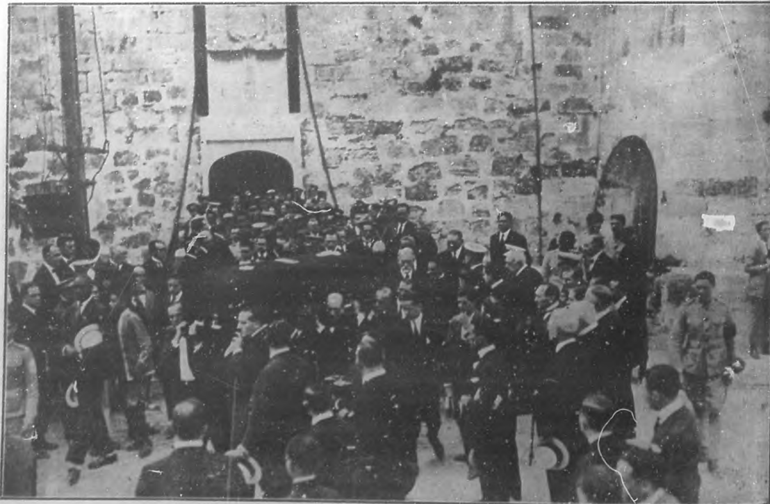
Momentos en que el féretro que contenía el cadáver del ilustre general Castillo Duany era sacado en hombros, del Castillo de la Fuerza, donde estuvo expuesto en capilla ardiente.

En el entierro del general Castillo Duany pusieron de manifiesto la alta estimación y el gran afecto que nuestro pueblo le tenía, pues el sepelio constituyó una imponente manifestación de duelo.