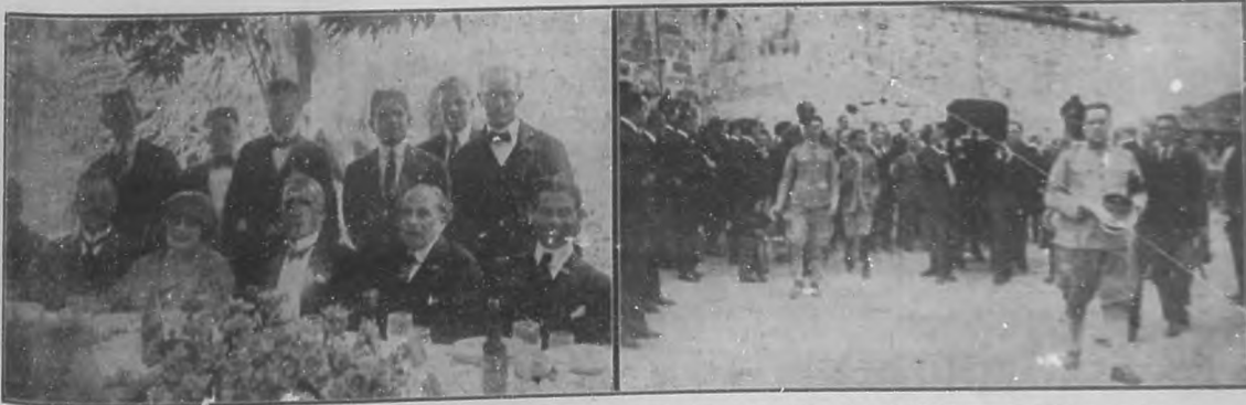
A la izquierda.—Presidencia de la mesa en el almuerzo que le fué ofrecido a los delegados al VI Congreso Médico en los manantiales de San Francisco de Paula.—A la derecha: un aspecto del entierro del general Demetrio Castillo Duany, en los momentos en que se ponía en marcha.